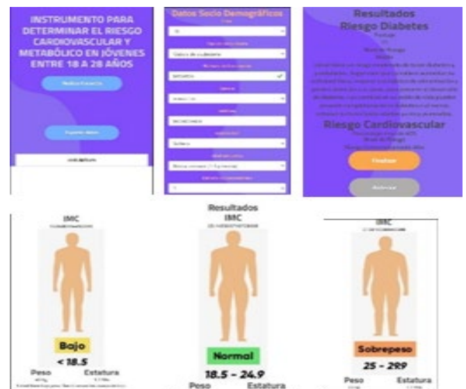
Interfaz de usuario diseñada para la aplicación AppCardio.